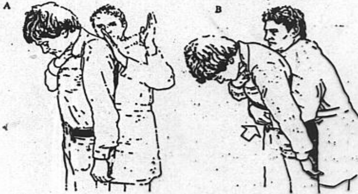
Gambar 7 : Pukulan punggung (A) dan hentakan abdomen (B) Untuk sumbatan benda asing pada korban sadar berdiri atau duduk.